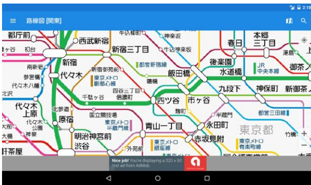
北海道から沖縄まで日本全国の路線をカバー