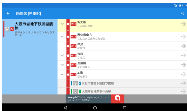
停車駅の案内表示